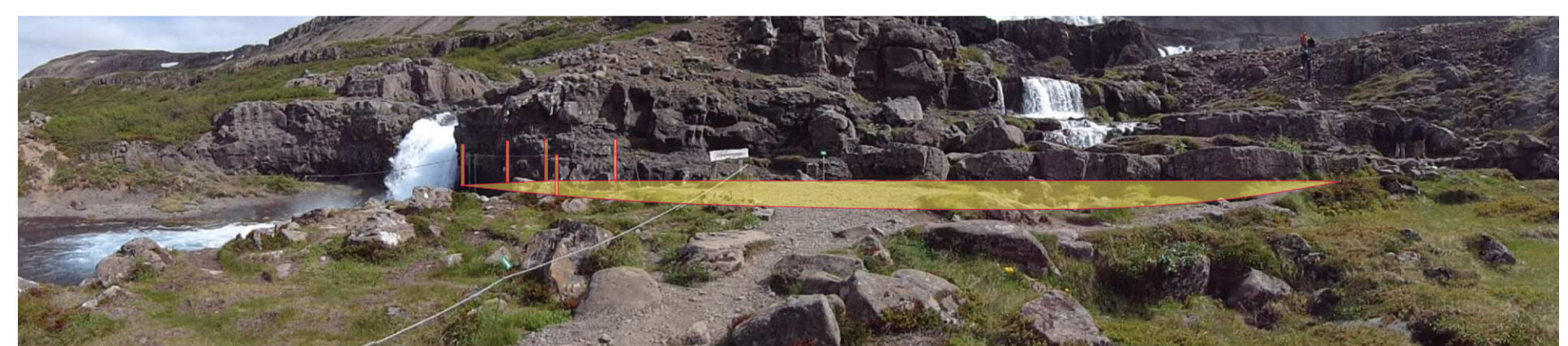
Ú2 Áningarstaður við Göngumannafoss - efnisval, núv. náttúrusteinarnýttir sem bekkir, pallgölf úr timri eða járn