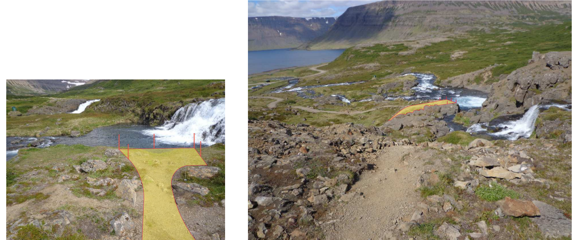
Ú1 Áningarstaður við Hrísvaðsfoss/Kvíslarfoss - aðstaða f. hreyfihamaða (m.a. umferð hjólastóla) - efnisval, pallgölf úr timri eða járn og létt öryggishandrið