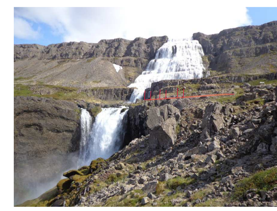
Ú4 Áningarstaður til hliðar við Strompgljúrafoss - spöng er skagur út fyrir klett, tilkominamikil sýn á Strompgljúrafoss og árgil - efnisval, stálbiti, járnrist og létt öryggishandrið