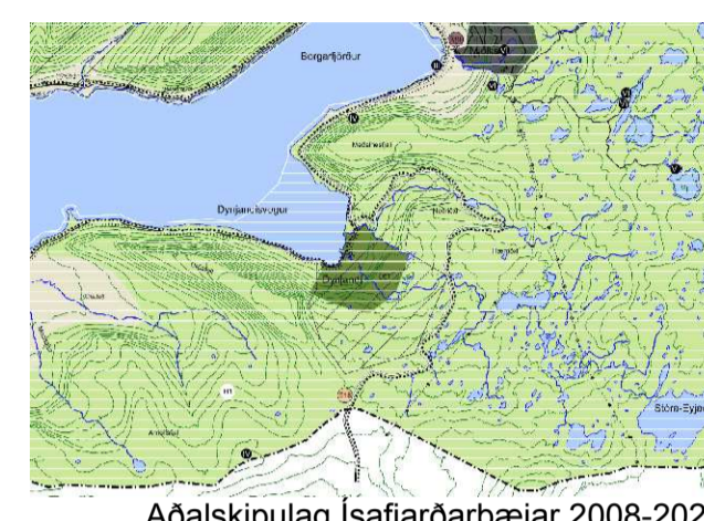
Aðalskipulag Ísafjarðarbæjar 2008-2020

Deiliskipulag þetta var samþykkt af umhverfisstofnun Ísafjarðarbæjar þann _____ Deiliskipulag þetta var auglýst frá _____ til _____ Deiliskipulag þetta, sem fengið hefur meðferð samkv. gr. 41 í lögum nr. 123/2010 var samþykkt í bæjarstjórn Ísafjarðarbæjar þann _____ Auglýsing um gildistöku deiliskipulagsins var birt í B-deild Stjórnartíðinda þann _____