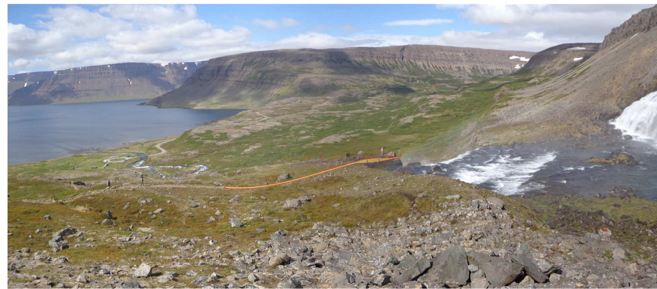
Ú5 Áningarstaður til hliðar við Dynjandi - handrið við klettabrún og lítil útsýnispallur nær Dynjandisfoss. Efnisval, undirstöður úr stálbitum, gölf timbur- eða járnristar, létt öryggishandrið mót fossi.